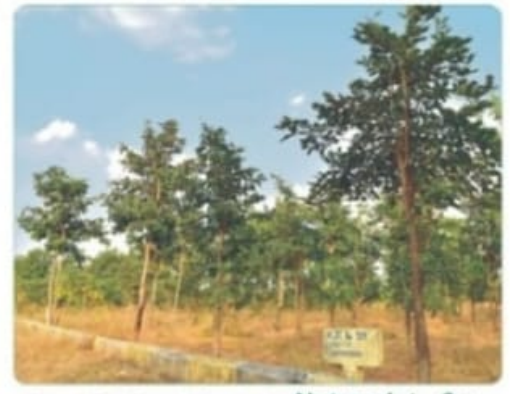
Present Red Sandal Tree in Our Nature Infa City at Pagidipally Vil., Near Bibinagar.

Form Land Plan Showing in Sy. No. 252, 253, 254, 255, 256 & 237 Situating at Panthangi Village, Chowtuppal Mandal, Yadadri Dist.